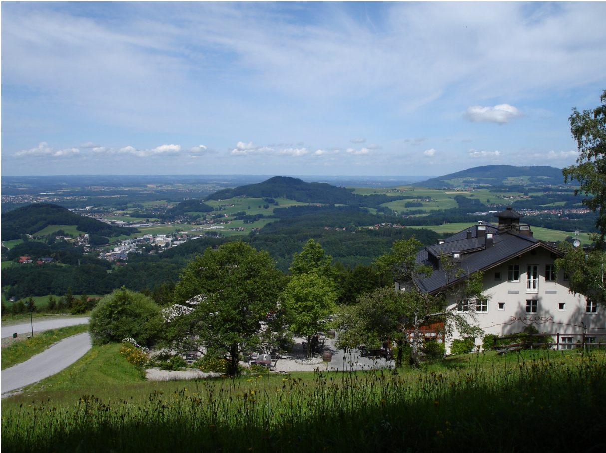
Abb. 1.15: Blick vom Gasthaus Daxlueg nach Norden auf die glazial überprägte Landschaft des Rhenodanubikums.

Vom Parkplatz beim Gasthaus Daxlueg führt ein Forstweg nach Nordosten. An den Böschungen sind manchmal kalkreiche Turbidite der Kalkgraben-Formation (Campanium) aufgeschlossen. Diese baut die steilen Hänge des Heuberggipfels auf. Nordöstlich des Gipfels deutet ein auffälliger Einschnitt auf relativ weiche Gesteine im Untergrund hin. Tatsächlich zieht hier eine NW-SE-streichende Störungszone durch, an welcher ultrahelvetische Buntmergelerde und Nummulitenkalksandsteine der Kressenberg-Formation hochgeschürft sind. Nordöstlich dieses schmalen Fensters steht wieder Kalkgraben-Formation an.